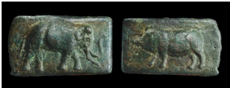
Dos lingotes Aes signatum, Elefante y Cerdo.

Las marcas de los lingotes solían ser figuras de animales como el buey, el carnero, el cerdo o incluso el elefante; se piensa que estas marcas representaban primitivamente el valor de cambio de las piezas de metal, lo que explica el hecho de que los romanos designasen el dinero como pecunia , ya que pecus significa «ganado» . Una ley del siglo IV establecía esta proporción: 1 buey = 10 ovejas = 1 libra de bronce.