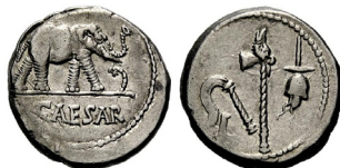
Denario, Imperio romano. Julio César. 48-47 a.C. Taller itinerante. Elefante aplastando a una serpiente. Atributos sacerdotales.

Denario y dinero. El término «dinero» es sinónimo de «moneda»; procede de una moneda romana de plata: el denarius (que equivalía a 10 ases). Aunque para nosotros «dinero» tiene el significado de «moneda corriente», fue el nombre de diversas monedas acuñadas durante la Edad Media; así se llamó una moneda de plata y cobre usada en Castilla en el siglo XIV. Además, en varios países árabes se utiliza como unidad monetaria el dinar , cuyo nombre deriva, a través del griego δηνάριον , del latín denarius .