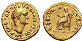
Áureo, Imperio romano. Vespasiano. 69-79 d.C. En reverso. La diosa Fortuna sedente.

Entonces Vespasiano le puso en la nariz unas monedas procedentes del primer pago y le preguntó: "¿Acaso te molesta su olor?". Tito lo negó, no le molestaba. A lo que Vespasiano contestó: "Pecunia non olet" (El dinero no huele).